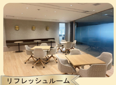
リフレッシュルーム